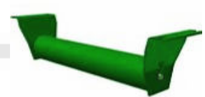
RNS: Retorno Normal Simple