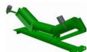
CAT: Carga Autoalineante triple