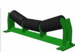
CIT: Carga Impacto Triple