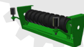
RAS: Retorno Autoalineante Discos