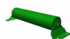
CNS: Carga Normal Simple