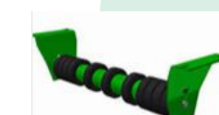
RDE: Retorno Discos Estándar