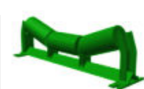
CNT: Carga Normal Triple