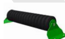
CIS: Carga Impacto Simple