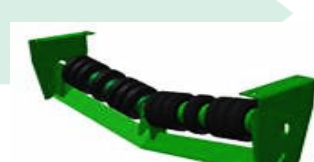
RAS: Retorno V con discos